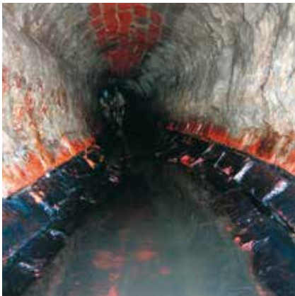
Eiprofil 600/900 vor der Sanierung