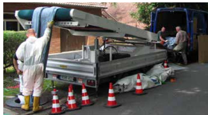
Einbau mit Förderband