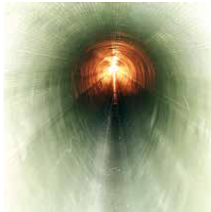
Eiprofil 600/900 mit GFK-Inliner saniert