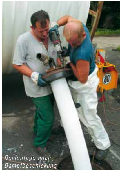
Demontage nach Dampfbeschießung

Querschnittes von bis zu 35% erleichtert das Einziehen über vorhandene Schächte oder in die zu sanierende Leitung. In Abhängigkeit von der Nennweite können mehrere hundert Meter auf eine Trommel gewickelt und eingezogen werden.