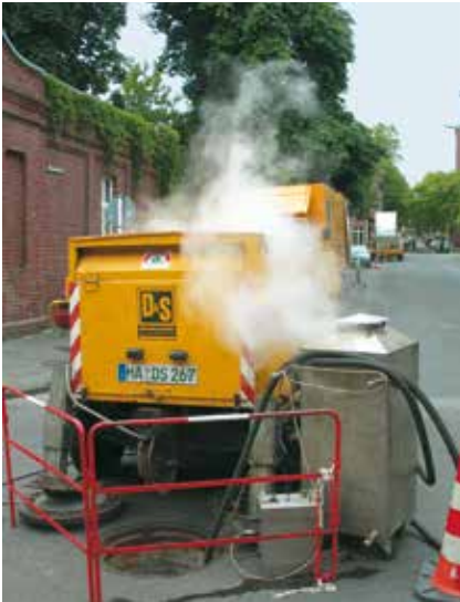
Das eingebaute Compact Pipe Rohr wird mit Dampf aufgestellt