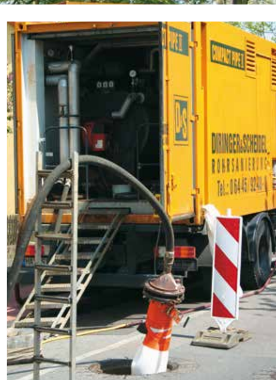
Kesselanlage mit Dampf