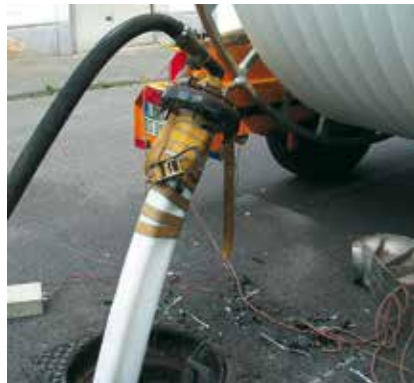
Das Compact Pipe Rohr wird mit der verfahrenstypischen Verformung eingezogen

close-fit mit der Qualität einer Neuverlegung