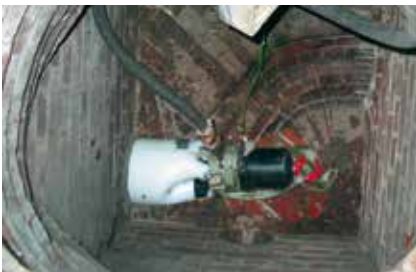
Drucktöpfe verschließen das Dampfsystem